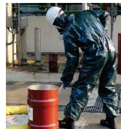
V naléhavých případech: Ochranné kombinézy a ochrana dýchacích cest