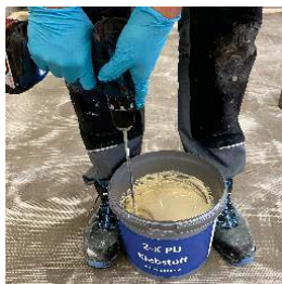
Celkové zakrytí pokožky Bezpečnostní obuv